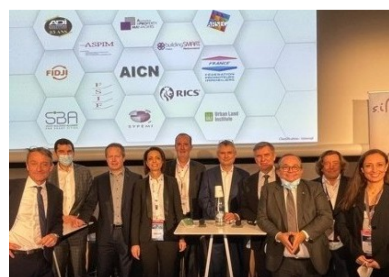
Les signataires de l'alliance au SIMI 2021